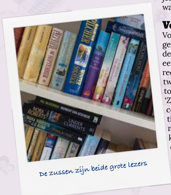
De zussen zijn beide grote lezers

☎ 0800 0711 🌐 www.spathodea.nl ✉ klantenservice@zorggroepcharim.nl