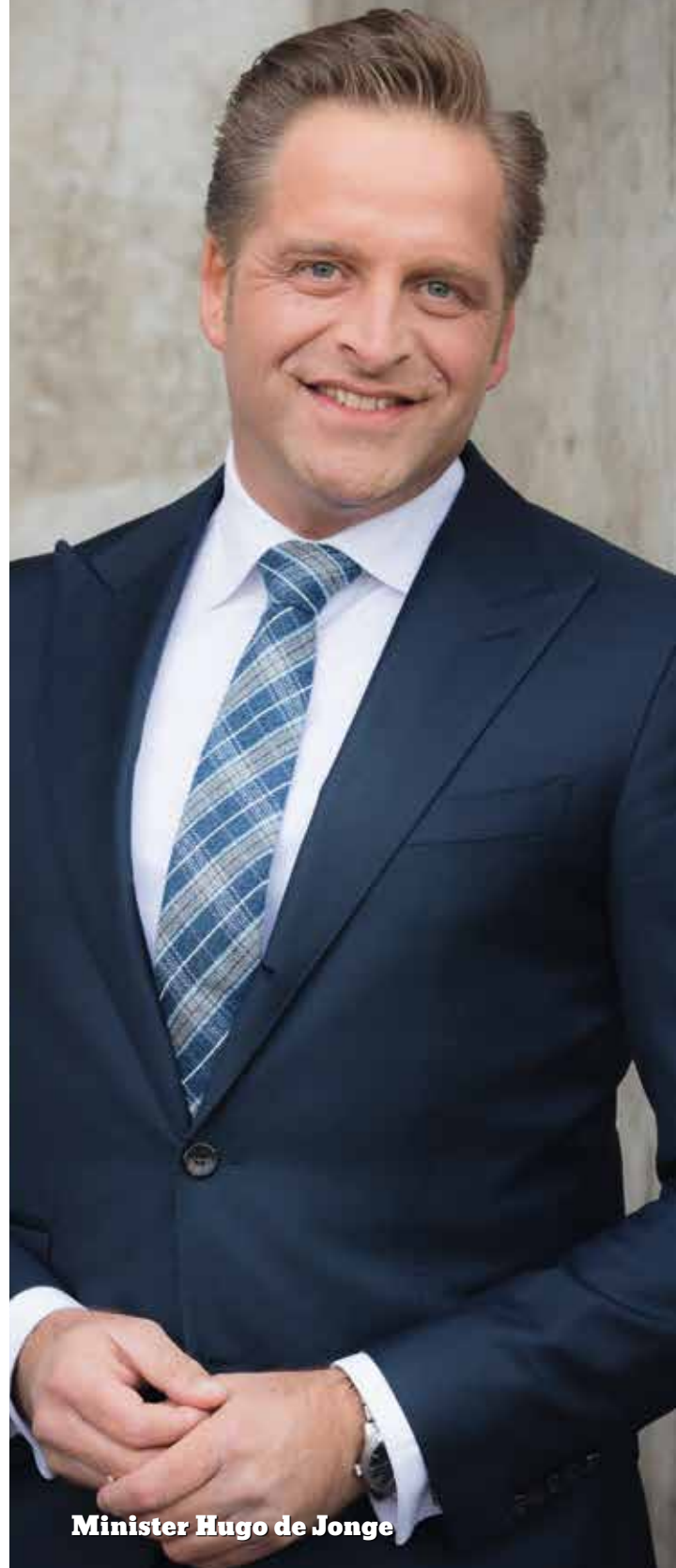
Minister Hugo de Jonge

Volgens de minister kent de zorg teveel overbodige regeltjes. 'Goede zorg is geen kwestie van wetten en regels. Goede zorg is mensenwerk. Bovendien kiest niemand voor de zorg vanwege een liefde voor papier en Excel. Daarom organiseert het ministerie zogeheten schrapsessies. Zorgprofessionals zitten bij elkaar en nemen alle regeltjes door. Daarbij geldt maar één criterium: is deze regel ergens goed voor, snappen we deze regel? En als je een regel niet kunt snappen, dan moet je hem schrappen. Dus dat heeft effect op de korte termijn, bij wijze van spreken morgen al.'