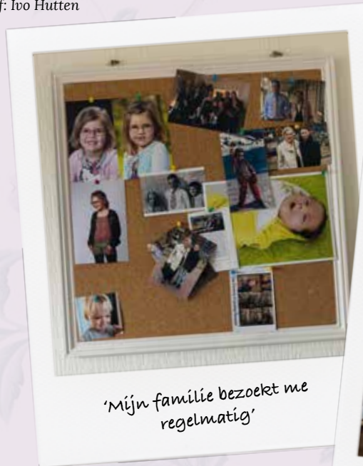
'Mijn familie bezoekt me regelmatig'