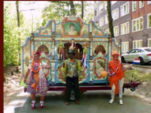
Draaiorgel 27 april (Koningsdag)